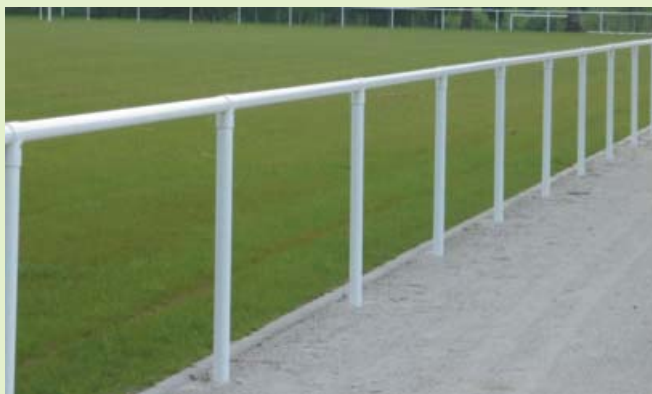
1. Main courante sans remplissage