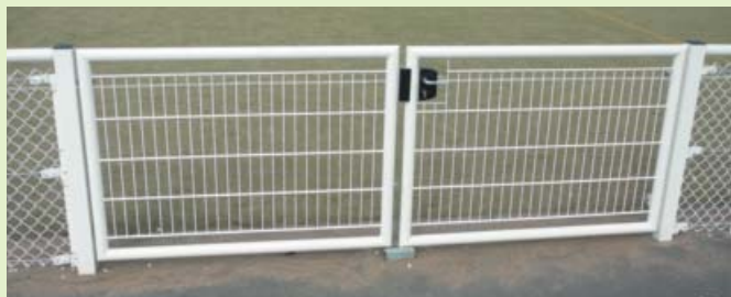
Portillons et portails assortis