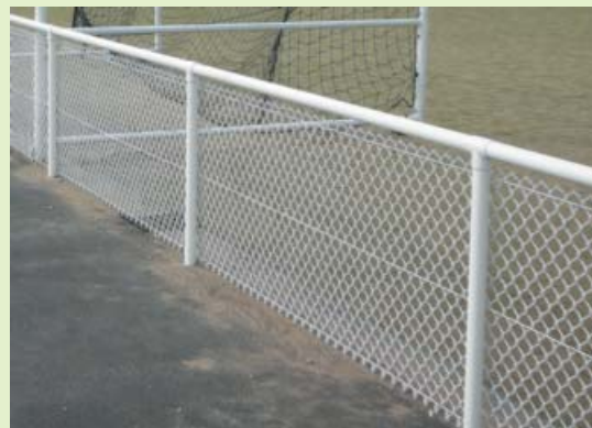
3. Main courante avec remplissage simple torsion