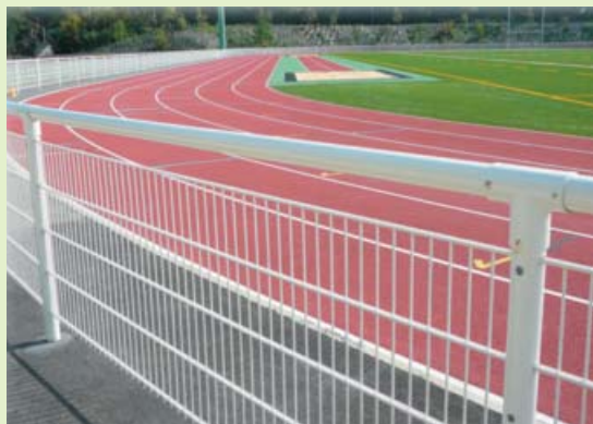
2. Main courante avec remplissage treillis soudé